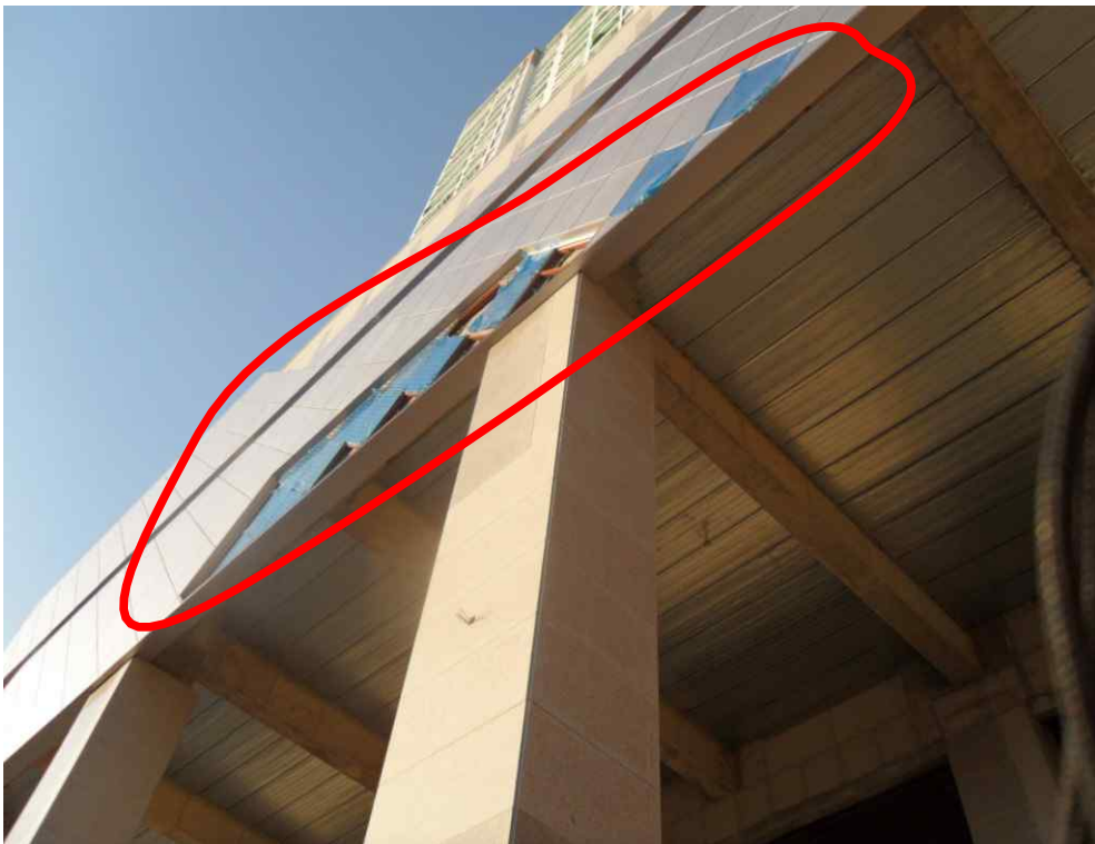
[ 사진 4 : 작업부위 ]