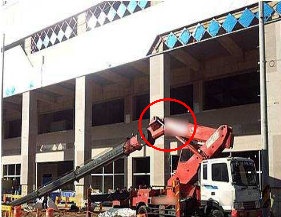
[ 사진 1 : 재해발생현장 전경 ]