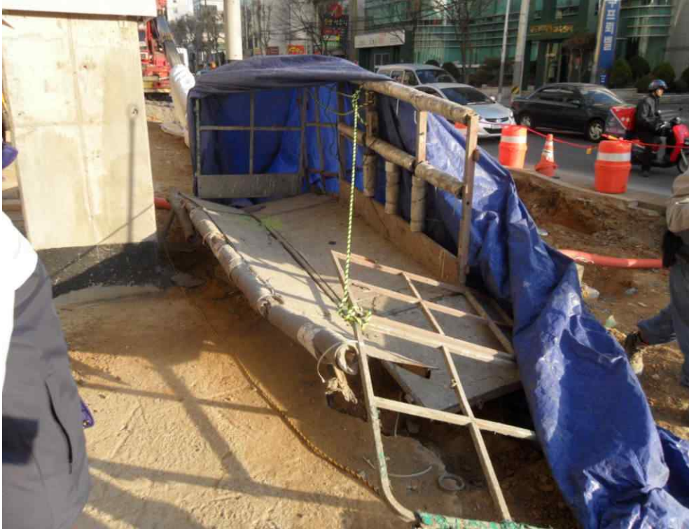
[ 사진 3 : 탑승중이던 작업대 ]